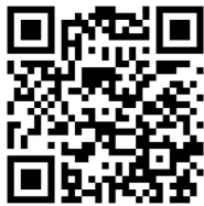
北方キャンパスの方はこちら

教科書販売、自動車学校キャンペーン、店舗営業時間、公務員講座や英語講座、旅行企画商品など、入学準備だけでなく、入学後も必要な情報を配信いたしますので必ずご登録をお願いします。