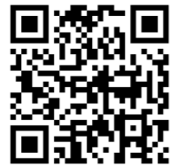
ひびきのキャンパスの方はこちら