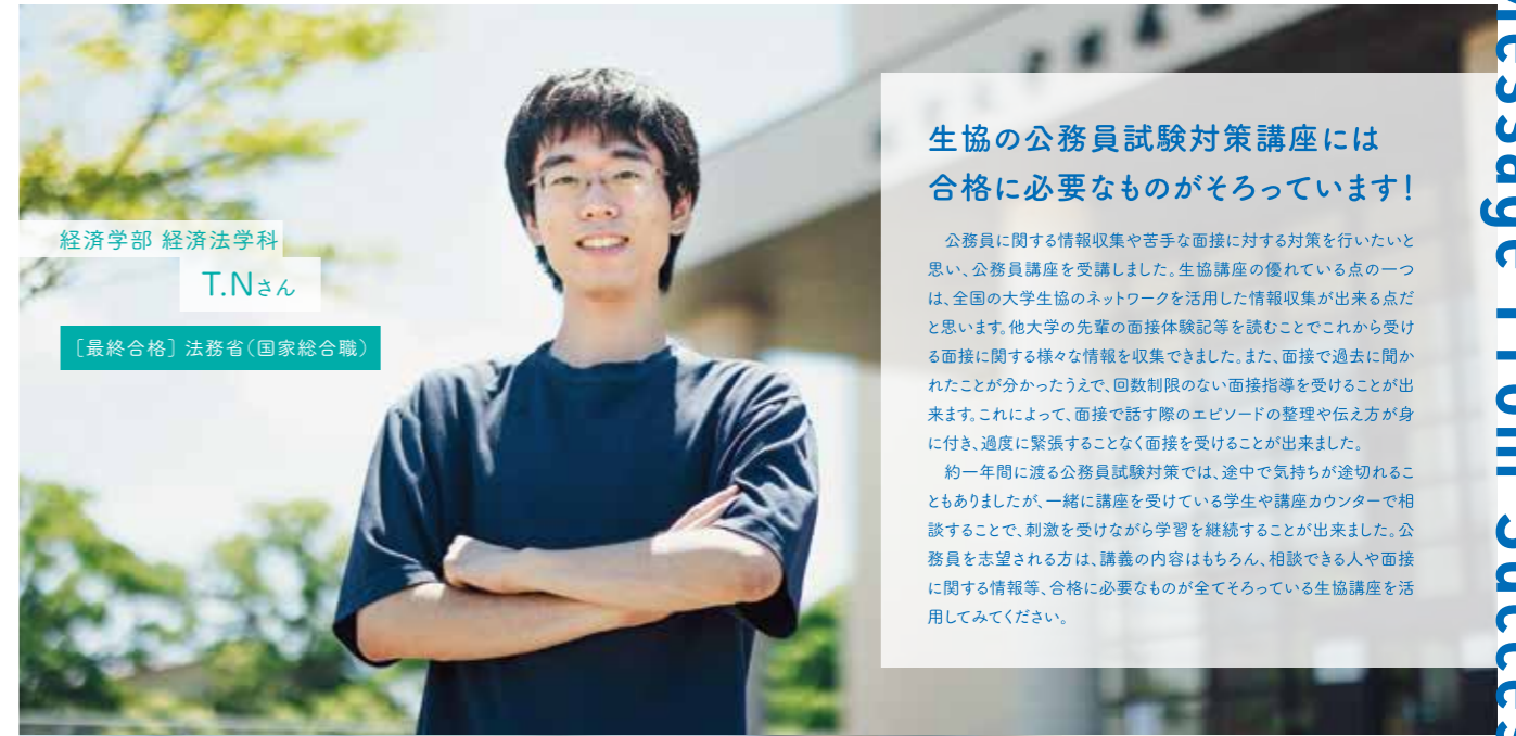
経済学部 経済法学科