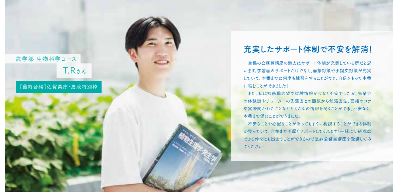
農学部 生物科学コース

持続可能な街づくりへの興味や学部での学びを活かしたいと考え、公務員を志望しました。独学の場合、学習はもちろん面接対策や試験情報の収集が難しいと感じ、受講を決意しました。大半の講義が対面のため、大学の講義が終わってから講座が始まるまでの時間を自習室や図書館での勉強時間に充てました。長い公務員試験対策の中でもカリキュラムの途中で小テストやオリジナル模試があることがモチベーションの維持につながったと思います。また、面接対策も手厚く、講師の方に直接悩みを相談したりアドバイスをいただいたりしたことで、面接への苦手意識を払拭して自信を持って挑むことができたことが良かったです。納得のいく就活になるよう応援しています。