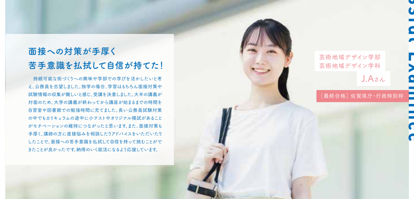
芸術地域デザイン学部 芸術地域デザイン学科

約一年間に渡る公務員試験対策では、途中で気持ちが途切れることもありましたが、一緒に講座を受けている学生や講座カウンターで相談することで、刺激を受けながら学習を継続することが出来ました。公務員を志望される方は、講義の内容はもちろん、相談できる人や面接に関する情報等、合格に必要なものが全てそろっている生協講座を活用してみてください。