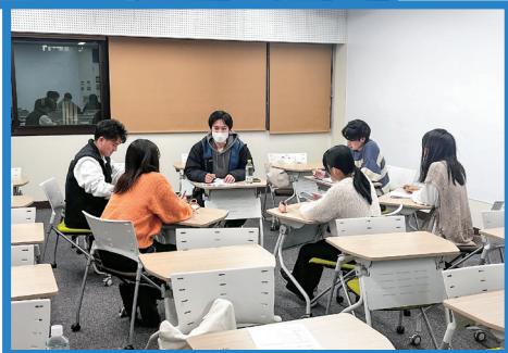
宮崎県庁の個別相談会の様子（年2回実施）