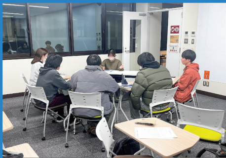
内定した先輩との相談会の様子