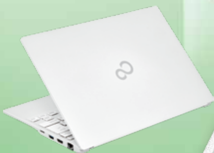
筐体色：シルバーホワイト