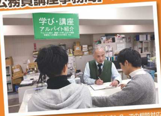
講座カウンターでの相談対応

毎日、講座カウンターで 待機しています。 受講生の不安軽減・ モチベーションアップできる 相談環境を作っています。