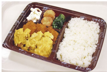
トンカツ玉子あん弁当