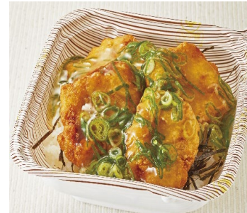
とり天あんかけ丼