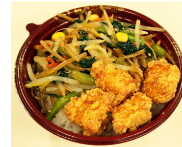
ミニ唐揚げビビンバ丼