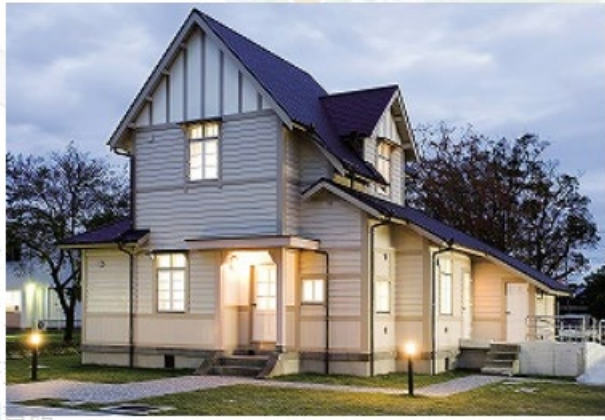
菊楠シュライバー館 (地域学歴史文化研究センター)