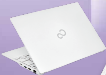
筐体色：シルバーホワイト