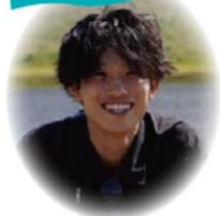
総合生産科学研究科 新社会人

卒業論文を制作していたとき、誤って飲み物をこぼしてしまい、パソコンが起動しなくなりました。締め切り間際だったためすごく焦りましたが、生協の修理受付カウンターに相談にいくと、早急に修理依頼を出すことができ、代替機を借りることもできました。おかげで無事に論文を書き終えることができ、生協でパソコンを購入していて良かったと心から思いました。