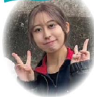
多文化社会学部 新3年生

私は入学時に大学生協以外でパソコンを購入したのですが、大学2年次の後期に、パソコンの液晶が割れるというトラブルに見舞われました。しかし、修理を依頼するにも修理店まで距離があり、すぐに対応することができませんでした。さらに、修理中は代替機を借りることができず、授業やレポートの作成、さらにサークル活動にも大きな支障が出ました。液晶割れの修理費用として約9万円が必要となり経済的にも負担が大きかったです。「代替機を借りられる環境の大切さ」「保証の大切さ」を、身をもって実感しました。