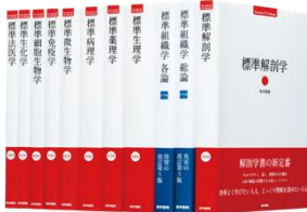
「標準シリーズ基礎セット(11冊) 医学書院