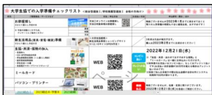
↑ 入学準備チェックリスト

全体説明の後は個別説明の時間に移りました。この時間では 新入生一組に対してアドバイザーが1名が担当し、ブレイクアウトルーム内で疑問や不安の解消を行いました！ 全体説明を聞いての質問対応のほか、学部に関する話や 入学準備チェックリストを用いての最終確認 などを行いました！