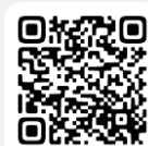
Apple Pencil Pro