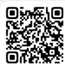
Apple Pencil USB-C

会場には コンセントがありません 。 Apple Pencil自体も充電が必要です! 充電/ペアリングの仕方はこちら→→