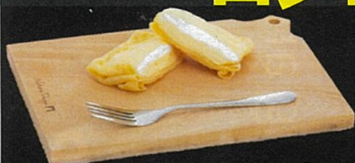
(カスタード&ホイップ)