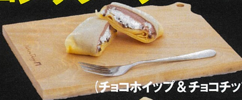
(チョコホイップ&チョコチップ)